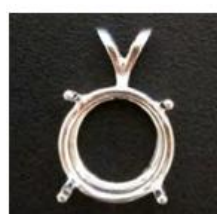
Geteilte Schlaufe (nur 12mm Stein)