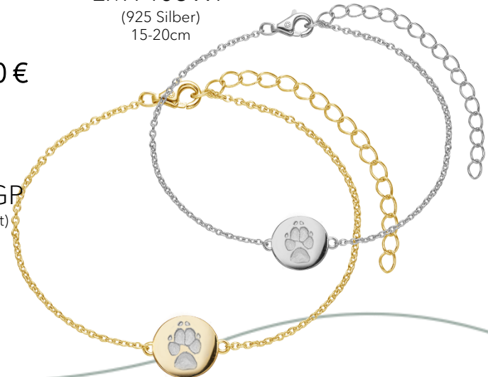
LM1403GP (18k vergoldet) 15-20cm