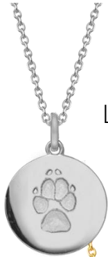
LM1401WP (925 Silber)