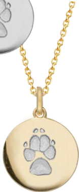
LM1401GP (18k vergoldet)