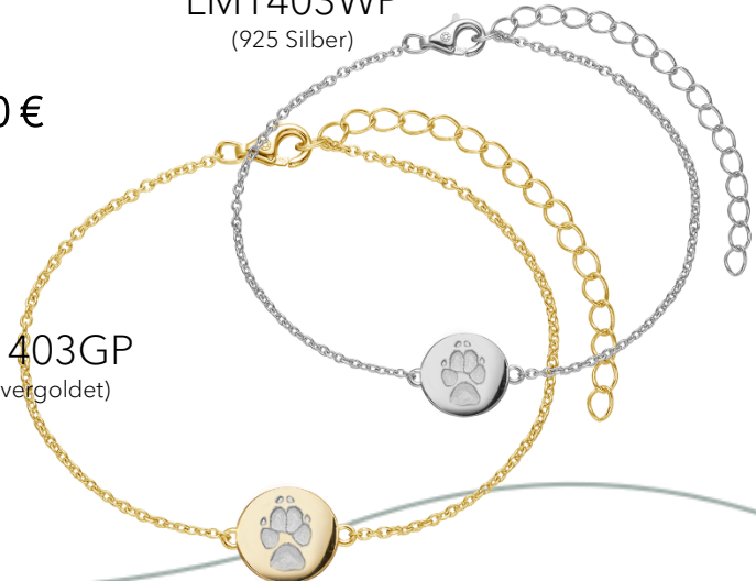
LM1403GP (18k vergoldet)