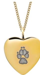
LM1411G (Edelstahl IP Gold)