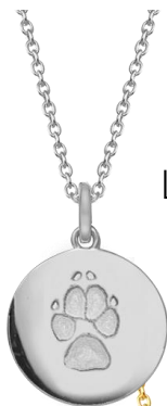
LM1401WP (925 Silber)