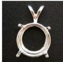
Geteilte Schlaufe (nur 12mm Stein)