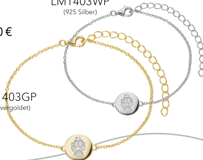
LM1403WP (925 Silber)