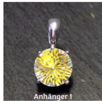
Anhänger 1 Schlaufe