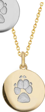
LM1401GP (18k vergoldet)