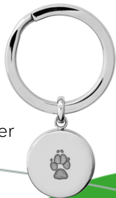
LM1122WP Inkl. Aschebehälter (Edelstahl)